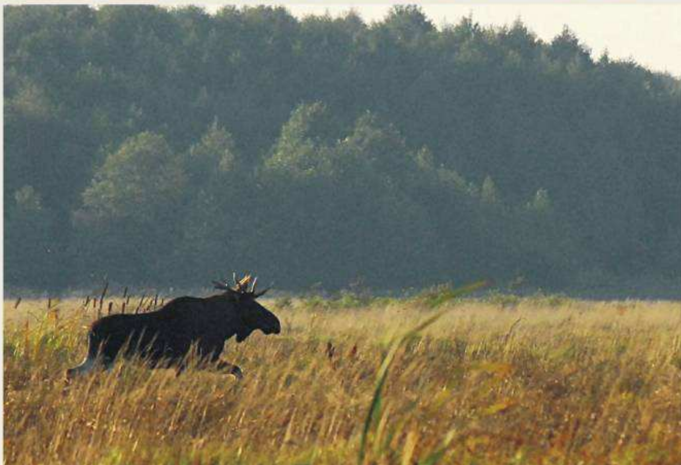
Niekoronowany król biebrzańskich bagien - Łoś ( Alces alces )