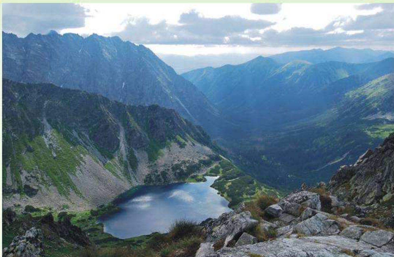
W sercu gór (Tatrzański PN) -II miejsce