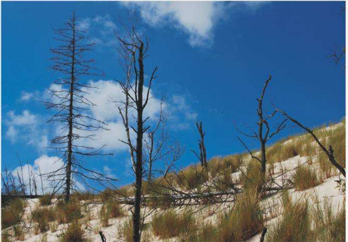
Las zasypany przez ruchome wydmy