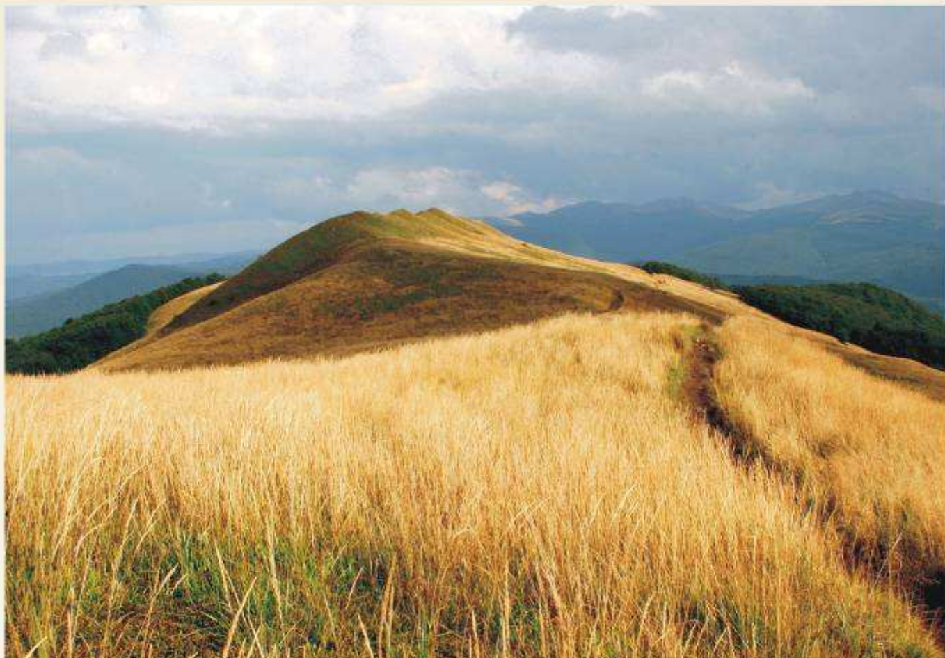
Bieszczadzkie Poloniny (I miejsce)