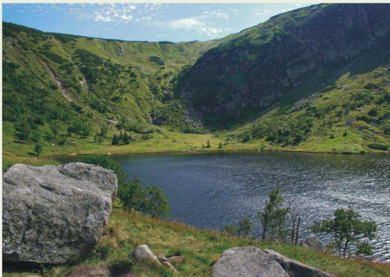
Staw pod Samotnią