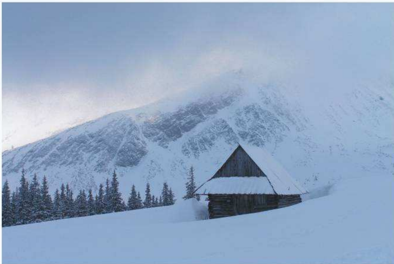
Bacówka na Hali Gąsienicowej